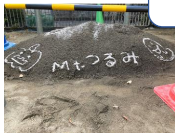
白砂で Mt.つるみ&ハロウィン

砂場の砂をきれいにしてもらうために業者さんがきました。掘り返してふるいにかけて。新しい砂を1m追加。安全な抗菌剤を散布してもらって完了です。きれいになった、たっぷりのお砂で子どもたちは砂遊びを謳歌しています！